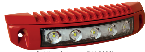
Gehäusefarbe rot (RAL3000)