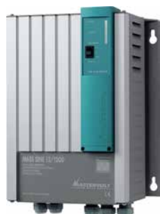
Mass Sine 12/1200

230V mit einem Wechselrichter aus der Batterie - diese Technologie ist nicht neu. Aber meistens ließen sowohl Wirksamkeit als auch Ausgangsspannungsqualität zu wünschen übrig. Mastervolt hat die Wechselrichter-Technologie optimiert und bietet eine umfassende Serie an äußerst effizienten Switch-Mode-Sinus Wechselrichtern an, die sehr geeignet sind für mobile Anwendungen. Der Mastervolt Wechselrichter ist ein qualitativ hochwertiges Gerät, das 12V Batteriestrom in 230V Wechselstrom mit einer stabilen 50 oder 60Hz Frequenz umformt. Der Wechselrichter hat 2 Anschlussstellen: eine für die Plus- und Minuskabel der Batterie und die andere für die 230V Verbraucher.