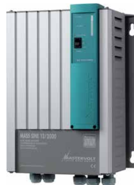
Mass Sine 12/2000