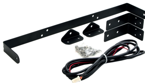
Montagematerial und Kabelsatz