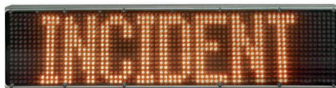
Foto zeigt LED-Display 5-9406-99 mit gelben LEDs

Dieses LED-Infoschild besteht durch die freie programmierbarkeit des Vollmatrix-Displays am PC, superhelle LEDs und kompakte Baugröße. Es sind bis zu 99 Nachrichten darstellbar. Die Montage erfolgt mittels Schwenk- oder L-Bügel.