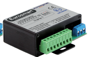
Leistungsteil „Submaster“ 8-82714