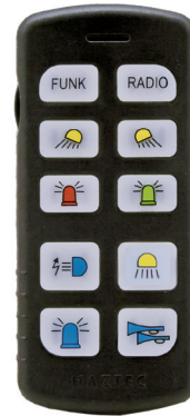
Bedienteil 8-82121 Österreich