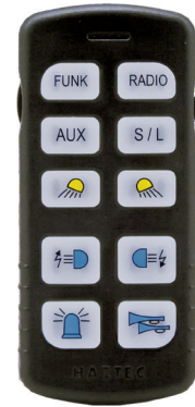
Bedienteil 8-82121 Deutschland