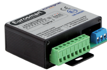
Leistungsteil „Master“ 8-82718

Eurosmart Version E erlaubt auf Ihrem Einsatz- oder Sonderfahrzeug ein kompaktes und dennoch leistungsstarkes Bedien- und Leistungssystem mit 8 Ausgängen auszuführen. Es ist Einbau- und Servicefreundlich.