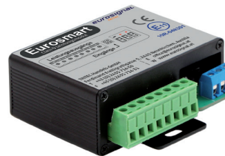
Leistungsteil „Master“ 8-82718